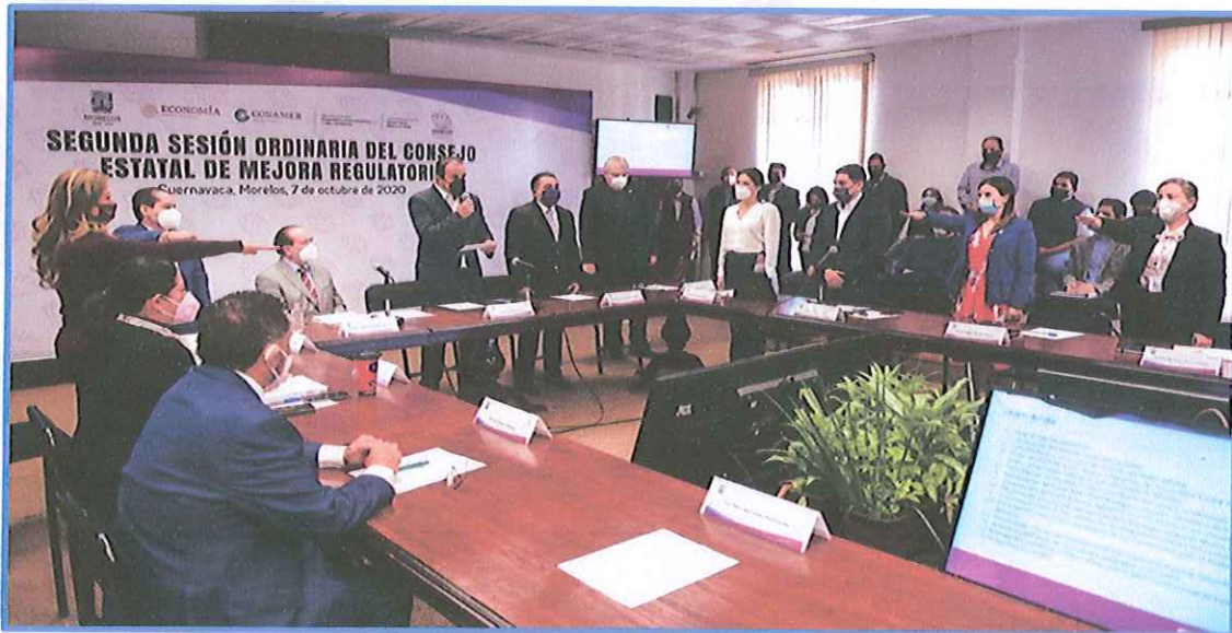
Img_001.jpg –Segunda Sesión Ordinaria del Consejo Estatal de Mejora Regulatoria. Palacio de Gobierno, Salón Morelos.

En la misma sesión ordinaria antes referida, el Consejo Estatal de Mejora Regulatoria, consiguió la aprobación de la "Estrategia Estatal de Mejora Regulatoria" , la cual se posiciona como el máximo instrumento jurídico después de la Ley de Mejora Regulatoria para el Estado de Morelos y sus Municipios, de la que se desprenden 14 objetivos, 33 metas y 87 líneas de acción, con un horizonte de implementación a 10 años. Asimismo fueron aprobados los "Lineamientos para el Análisis de Impacto Regulatorio" y el "Reglamento Interior del Consejo Estatal de Mejora Regulatoria" .