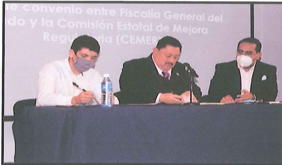
Img_004.jpg – Firma de Convenio de Colaboración con la Fiscalía General del Estado.

MORELOS ANFITRIÓN DEL MUNDO Gobierno del Estado 2018-2024