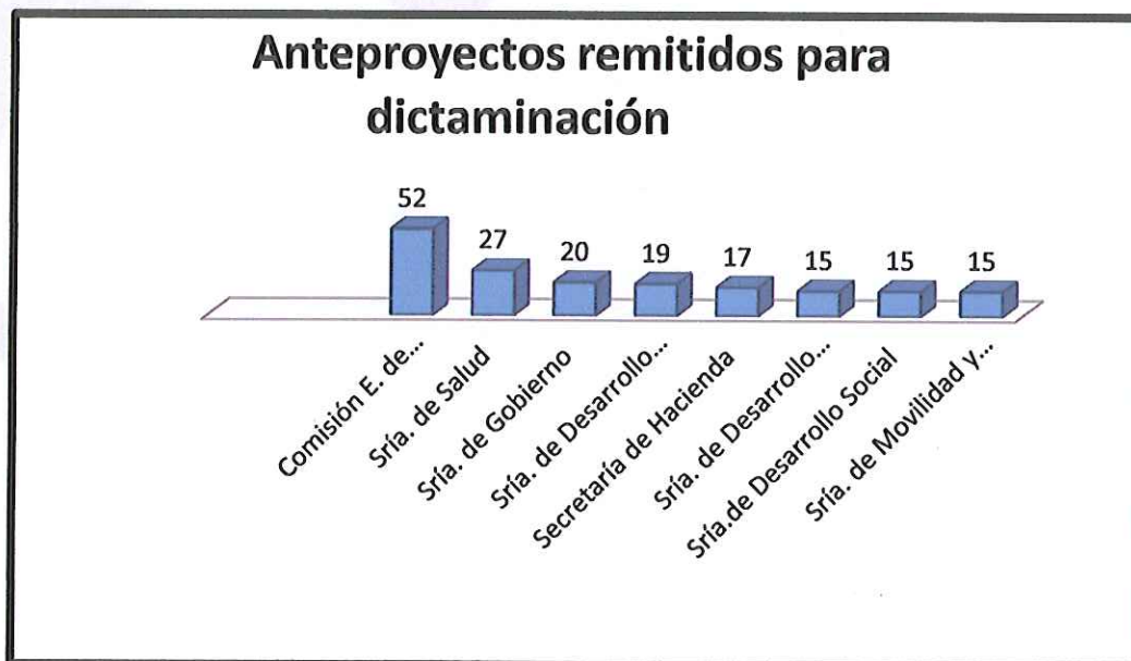
Img_002. – Presentación Grafica de regulaciones presentadas por los Sujetos Obligados Estatales

Lineamientos para la implementación del Análisis de Impacto Regulatorio Ex Post, herramienta que permite evaluar las regulaciones vigentes y los impactos económicos que han tenido en la ciudadanía desde su aprobación, para proponer áreas de oportunidad, en el marco regulatorio estatal, tal y como se puede apreciar en el desglose de la tabla, de los cuales resaltan su actividad los siguientes sujetos obligados: