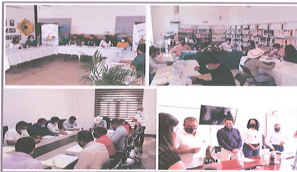
Img_007.jpg – Instalación de Consejos Municipales de Mejora Regulatoria

MORELOS ANFITRIÓN DEL MUNDO Gobierno del Estado 2018-2024