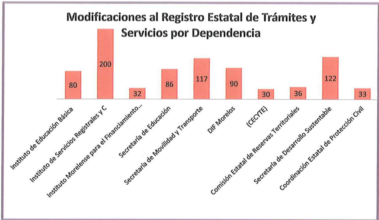
Img_005. – Presentación gráfica de los Sujetos Obligados que presentan acciones de mejora al RETyS.

MORELOS ANFITRION DEL MUNDO Gobierno del Estado 2018-2024